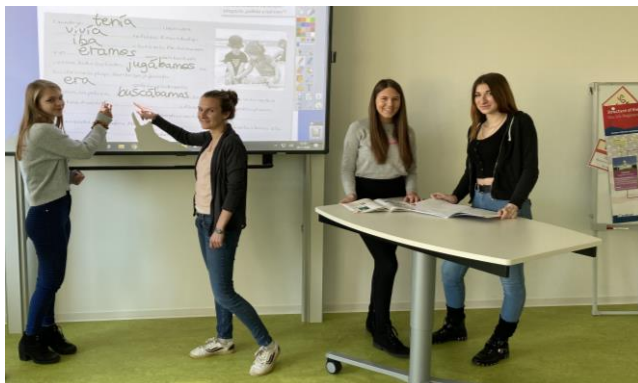
Spanisch-Unterricht am interaktiven Whiteboard